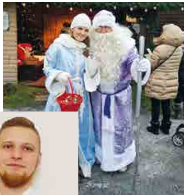
Suurtorin joulumarkkinat ovat oiva tapa kertoa kävijöille Seuran toiminnasta ja esitellä jäsenyyttä.