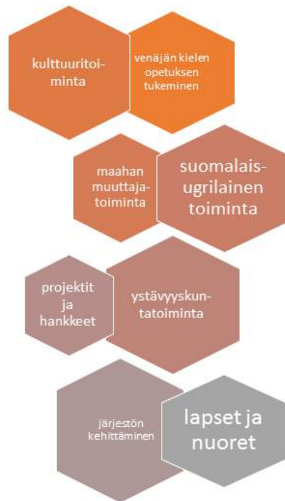
Toiminnan painopisteet vuonna 2020

kehitetään uusien rakenteiden mukaan entistä joustavammaksi ja monipuolisemmaksi. Vuonna 2020 Suomi-Venäjä-seuran toiminnassa keskitytään erityisesti paikallistoiminnan kehittämiseen sekä laaditaan uutta strategiaa vuosille 2020-2024.